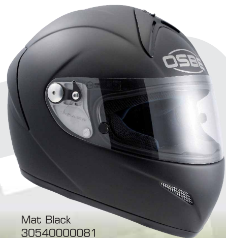
Mat Black 30540000081